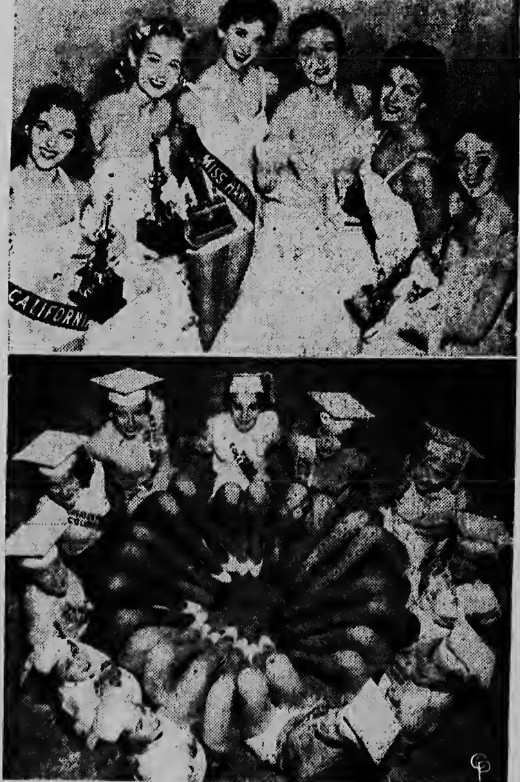
Un grupo di mucha muher a saca e portret aki na Atlantic City. Nan tin endu uno hopi chens di hanja e titulo di Miss America. Mas arilla e ganadornan di e prome pstantamento. E mucha muher mas bunita di colegio tambe mester a tuma parti den e final y e jurado mester a dieldi for ili e grupo mas abao.

Segun tuenienan generalmente di confianza, ne ministerio frances di relaciones exteriores nan ta pone deslasier detallesnan pa completa un memorandum pa cualkier accion eventual, den e kestion di Suez, ora e debate den Consejo di Seguridad termina. E contenido de memoranduman ta gran secreto.